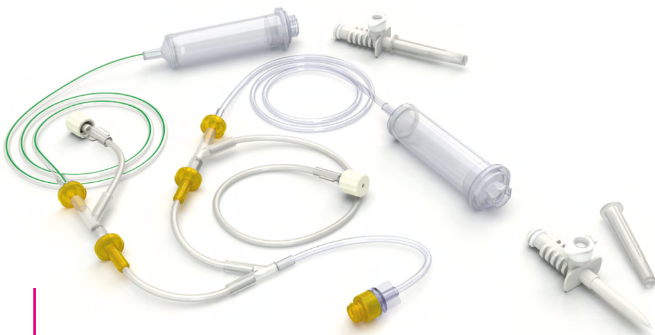
Day Safe Füllschlauch D Art. 312400-100