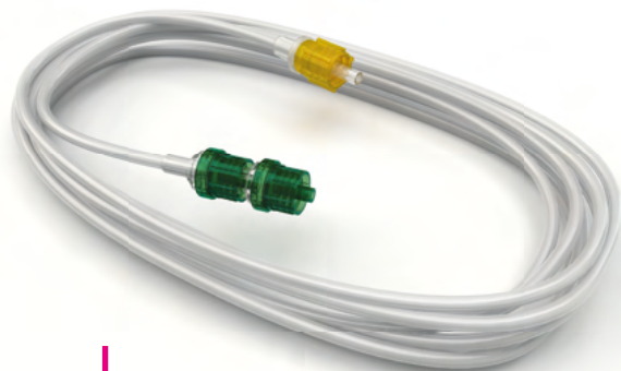
SUre Patientenschlauch Art. 318415-100