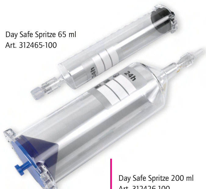
Day Safe Spritze 65 ml Art. 312465-100