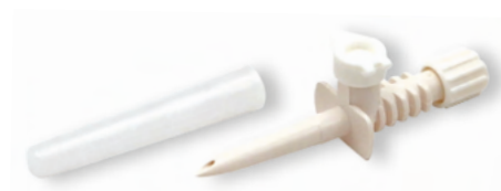
Spike Art. 314095-100